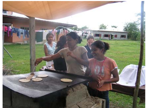
Tortillas were once made under a canopy—they are now made with a commercial stove.

Gracias a una familia generosa en Oregon, ya hemos ido “high tech”. Donaron las computadoras que estoy usando para escribir este informe, pagaron el servicio Internet en Nuestro Hogar de Niños. Los niños han estado aprendiendo usar las computadoras y ahora pueden usar la Internet.